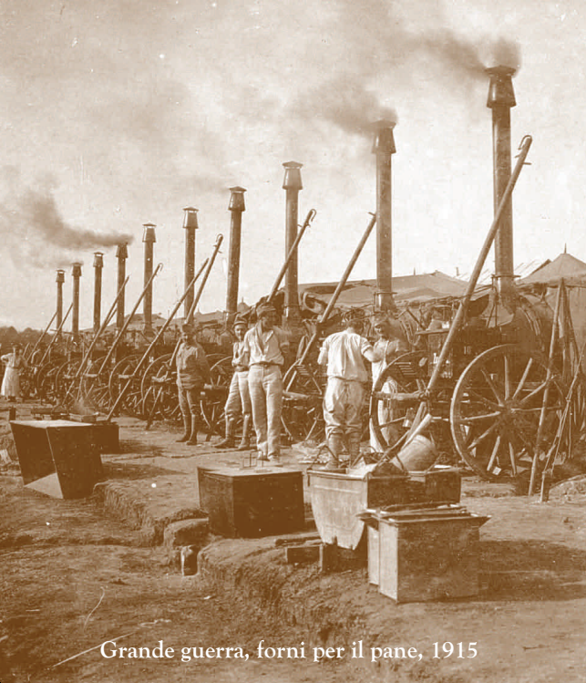
Grande guerra, forni per il pane, 1915