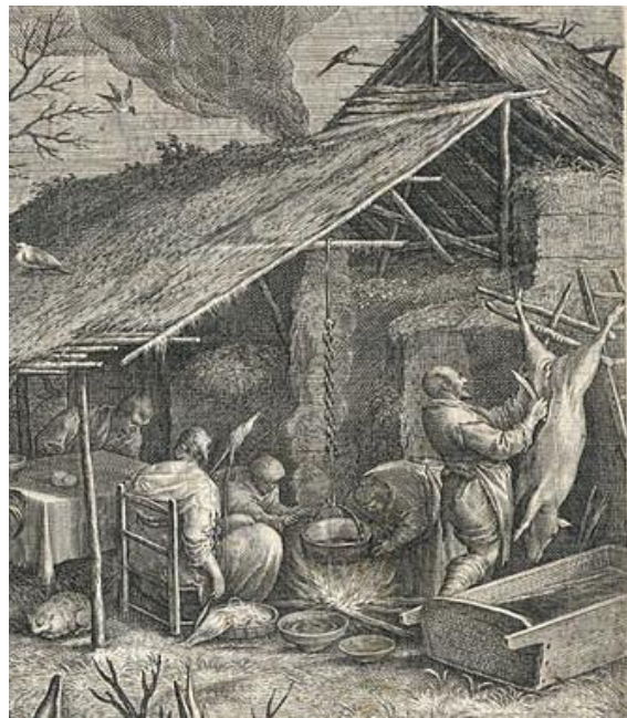
Francesco da Ponte detto Bassano (1549–1592) – L'inverno